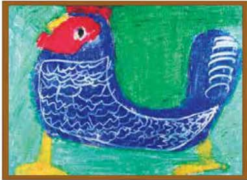
「つながるひろがるアート展Nas u」から タイトル『ニワトリ』