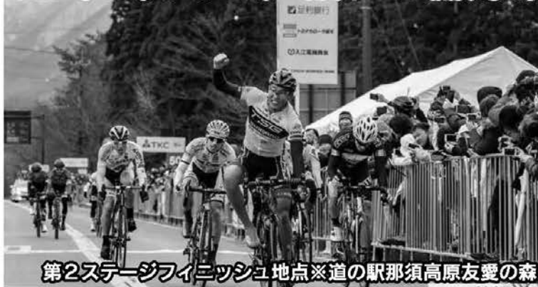
第2ステージフィニッシュ地点※道の駅那須高原友愛の森