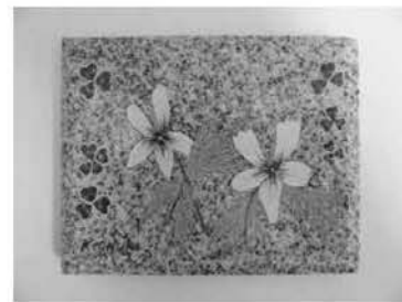
御影石アート見本

また、事前に御影石アートの作品展示を図書館入り口にて行いますのでこちらもぜひご覧ください。