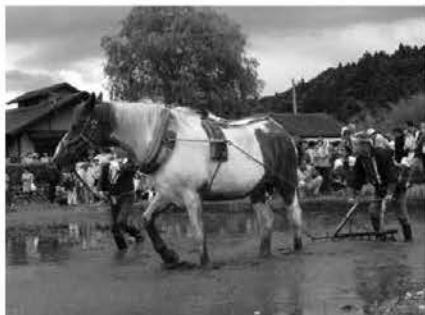
田植え祭りの様子