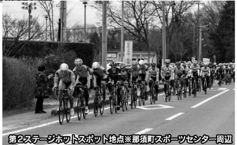
第2ステージホットスポット地点※那須町スポーツセンター周辺

第1回ツール・ド・とちぎの第2ステージは茂木町から那須町までの102km。真冬のような寒さの中、レースは開催されました。