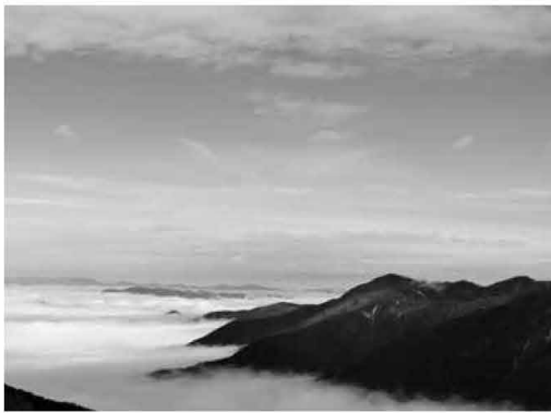
▲夏場は美しい雲海が見られる