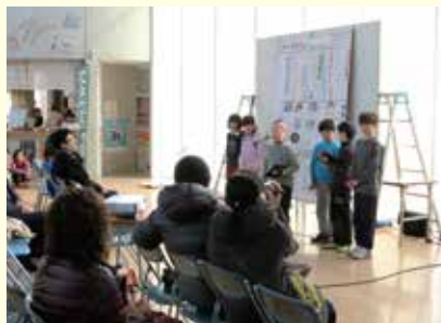
4年生 町の高齢者と福祉 「点字のすばらしさ」

2月17日ゆめプラザ・那須で、黒田原小学校4・5・6年生と地域住民による黒田原地域創生フォーラムが開催されました。「Re:Action(再起動)」をテーマに、4年生は「福祉」、5年生は「環境」、6年生は「町づくり」の視点から地域を見直し、班ごとに研究発表を行いました。未来ある児童たちが地域と一体となって地域創生に取り組み、素晴らしい研究成果を発表してくれました。