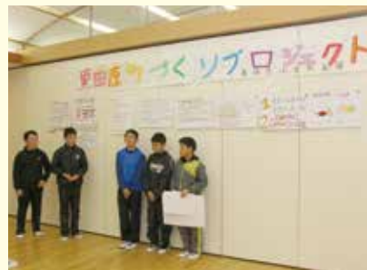
6年生 黒田原町づくりプロジェクト 「おいしい食べ物が多い町にしたい」