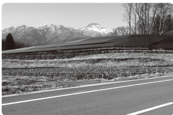
那須岳を望む場所に太陽光パネル

答 公園内の景観で十分配慮する部分については、今の考え方をもとに指導をしていく。