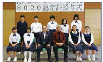
むし歯になつたことのない中学3年生

● 骨密度コーナー 先着100名に無料で骨密度測定を行い、測定後は保健師から結果の解説や骨を丈夫にする工夫について、1人1人説明がありました。骨粗しょう症は年齢を重ねるとなりやすいものですが、骨密度の減少を緩やかにすることと、若い頃にどのくらい、貯金、できたかがポイントです。若若男女みなさんに、自身の現状を知るため受けてもらいたい検査です。