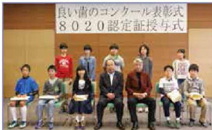
むし歯になつたことのない小学6年生

6月16日にゆめプラザ・那須で健康まつりが開催され、テーマの「歯」に関するブースなど、子どもも大人も楽しく健康について考える機会となりました。 遊びに来てくれたみなさん、ありがとうございました。