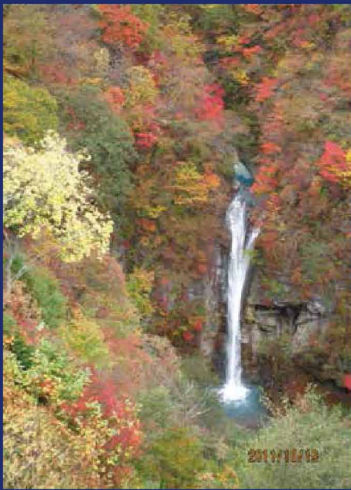
那須平成の森 駒止の滝