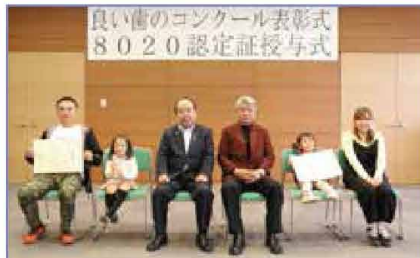
3歳児よい歯のコンクール・親と子のよい歯のコンクール最優秀賞