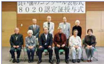
80歳以上で20本以上自分の歯がある「8020」該当者