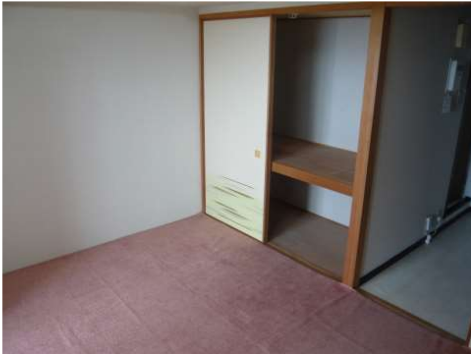
和室（6帖）※畳保護のためカーペット使用