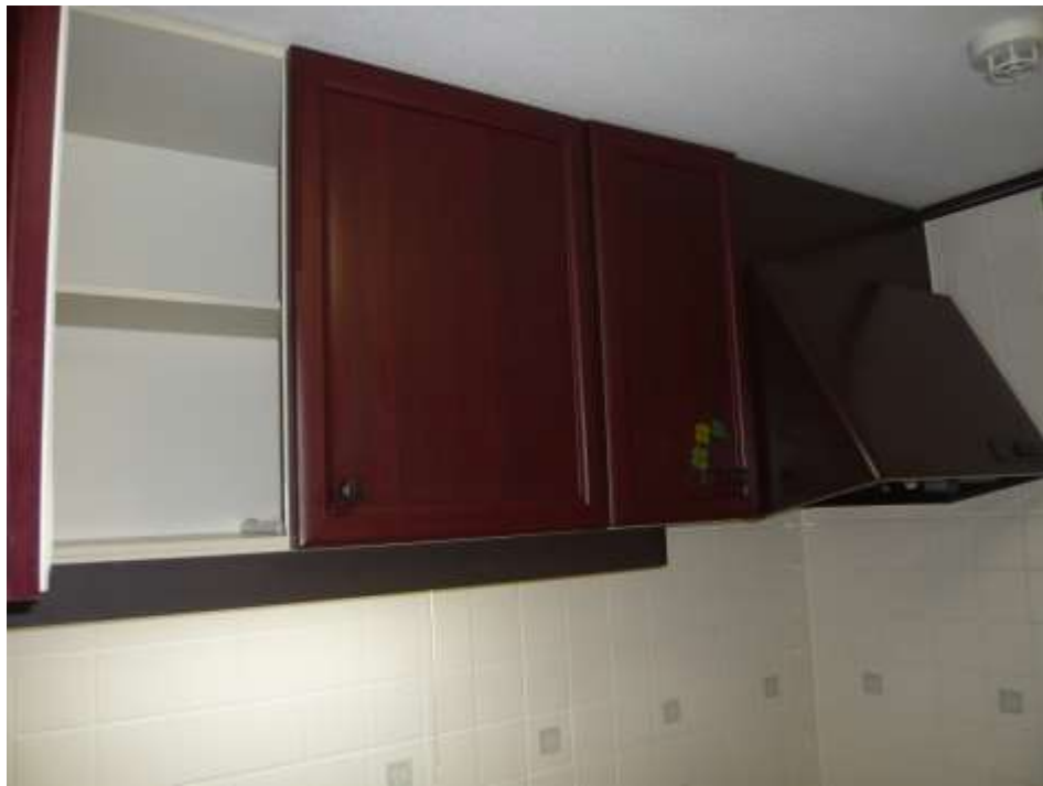
台所 (戸棚・換気扇)