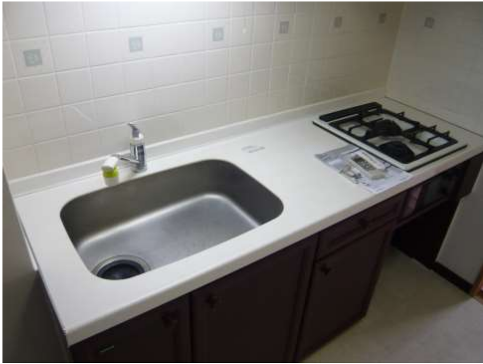
台 所 (シンク・ガスコンロ)