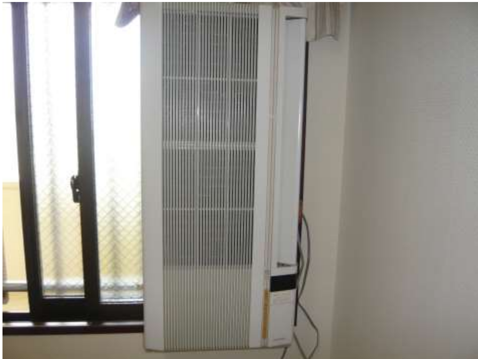
洋室①（窓付エアコンあり）