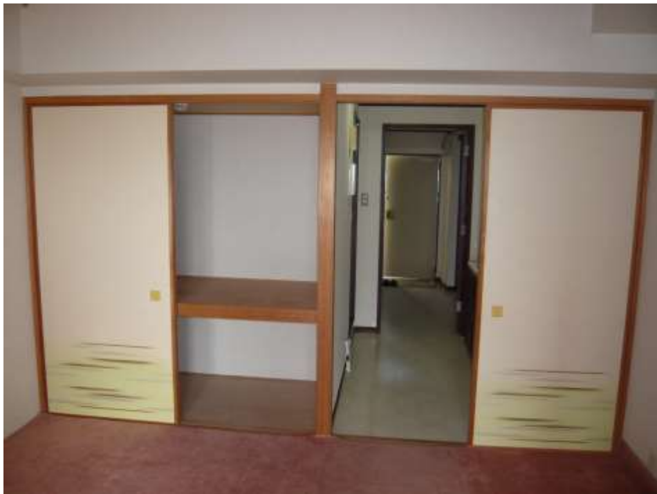
和室⇄玄関（※畳保護のためカーペット使用）