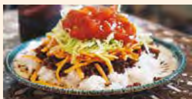
沖繩では定番のタコライス。那須町産の野菜や米を使用しています。

で開催されているマルシェ等に出店し、お客さまから感想をいただきながら商品開発を進めています。マルシェで提供しているメイン商品は「タコライス」と「沖繩そば」です。どちらも町ではあまりなじみの無い食べ物かと思いますが、沖繩ではソウルフードとして県民に愛されているもので、「タコライス」は那須産のトマトやたまねぎやお米等、「沖繩そば」は町の製麺所と協力し、地粉を使用したそばや那須産ポークの豚骨を使った出汁等、那須産の食材をできる限り使用して提供しています。 私の出身地である沖繩と現在住んでいる那須町。気候も食文化も違いますが、町の食材を使用した沖繩料理でそれぞれの良さを引き出し、新しくおいしいと感じていただけるようさらなる商品開発を進め、町内の方はもちろん町外の方にも認知していただけるようPR活動を実行していきます。 今後町内や周辺地域で開催されるマルシェに出店していく予定です。ですので見かけましたらぜひ一度召し上がってみてください。