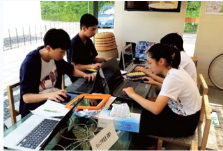
ジュニア学芸員の活動の様子

○公民館企画事業 町内4つの公民館では、地域住民を対象として、指導者育成、学びの場づくりのためのイベントやワークショップを開催します。 ▼問合せ 学校教育課 学校教育係 ☎(77)6922