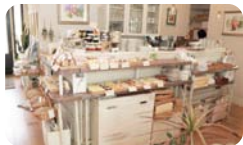
クッキーなどの焼菓子や、ジャムなどは手作りで