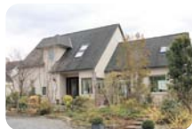
お店は四季折々の花木に囲まれています