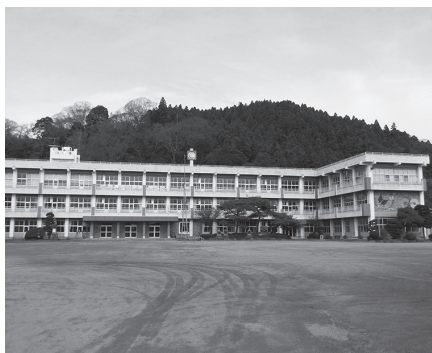
早急な再整備が待たれる旧伊王野小学校