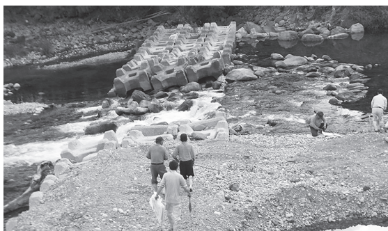
水源で農業用水の確保作業