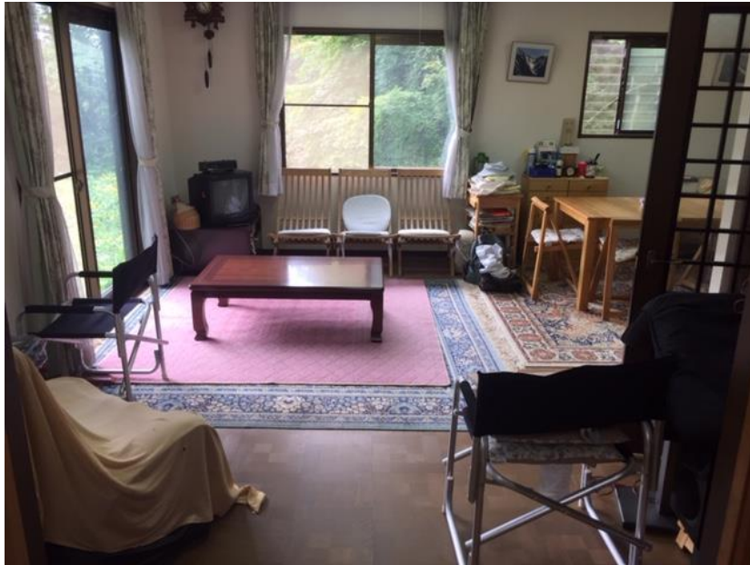
リビングダイニング②