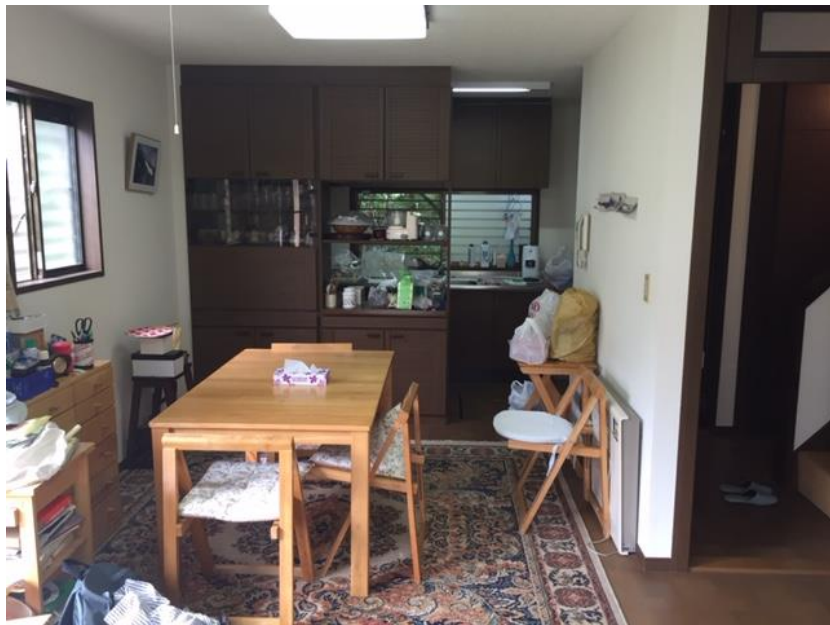
リビングダイニング①