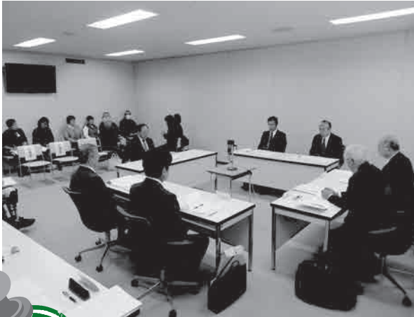
12/5民生文教常任委員会 陳情審査の様子

今回は3件の陳情が出され、 委員会審査は全て民生文教常任委員会に付託されました。