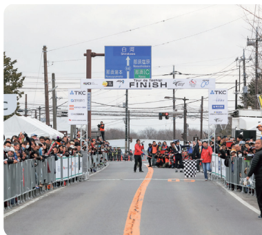
第2回ツール・ド・とちぎ那須町コース会場の様子

▼大迫力のゴール地点 さまざまなブースや、実況解説も聞き取ることができ、なんととっても大迫力のゴールの瞬間は必見です。