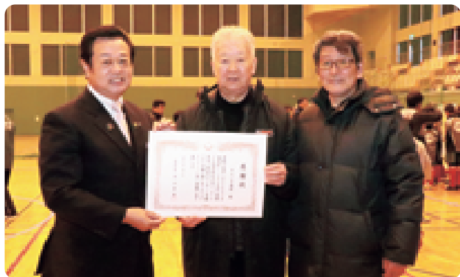
那須地区少年サッカーの普及と技術向上に貢献したとして、セルジオ越後さん（写真中央）に町から感謝状を贈りました（2/2 第40回セルジオ越後杯争奪戦 スポーツセンター）