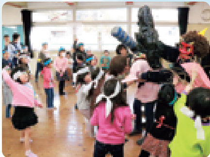
鬼はそと福はうち。保育園にきた鬼と一緒に、自分の中にある悪い鬼も追い出しました (2/3 豆まき 大同保育園)