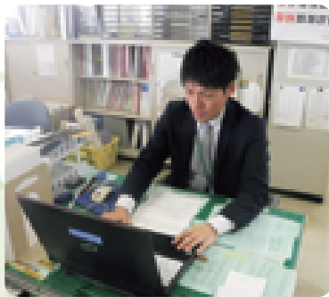
デスクワークもこなします

〇どんな職員になりたいか 町内全域を見渡せる職員になりたいと考えています。私は那須町出身で、自分が慣れ親しんだ那須町のために貢献したいと思いついた職員になりました。しかし実際業務を行う中で、自分がかみで見てきた那須町が、町のごく一部分でしかなかったことに気が付きました。これからは現場を回りながら、各地域に目を向けていけるよう努めていきたいです。