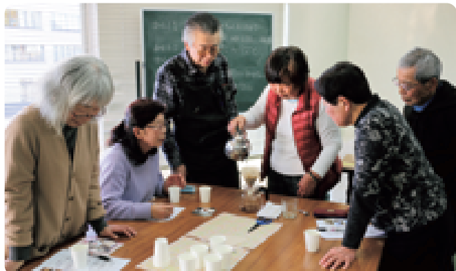
「自宅でおいしいコーヒーを楽しむ」をコンセプトとした珈琲講座には約20人が参加し、珈琲焙煎士から入れ方のポイント等を学びました（2/19 図書館）