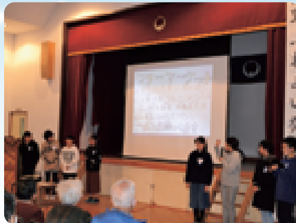
東陽小学校4~6年生の児童たちが、合唱や総合的な学習について発表しました (2/12 芦野ふれあい発表会 芦野公民館)