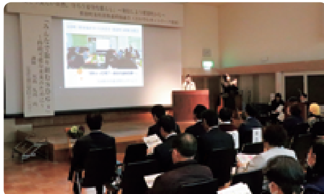
「残そう美しい自然、守ろう安全な暮らし」～発信しよう那須町から～をテーマに、さわやかネットワーク那須が1年間の活動報告を行いました（2/2 第16回みんなの集い那須 文化センター）