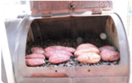
最近人気の新品種シルクスイートや、昔ながらのホクホク感がある紅あずまなど4種類があります