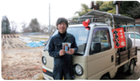
石焼き芋を真空パックした商品もあります