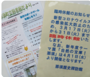
テイクアウトや時短営業に関するチラシ、臨時休館の貼り紙や写真など

探訪館では、新型コロナウイルス感染に対応する、町内の様子を記録するため、ポスターやチラシなど関連資料を収集しています。「緊急事態」を伝える資料は重要なものになりますので、ご協力をお願いいたします。 ▼問合せ 那須歴史探訪館 ☎74-7007