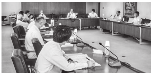
森林政策に関する意見交換会