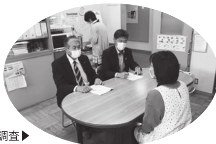
保育園での聞き取り調査▶