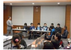
(特別支援教育セミナー)