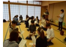
(親学習プログラム)