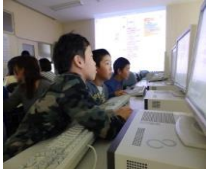
(プログラミング教育)