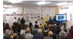
(総合的な学習の時間の充実)