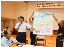
(和い輪い学習フォーラム)