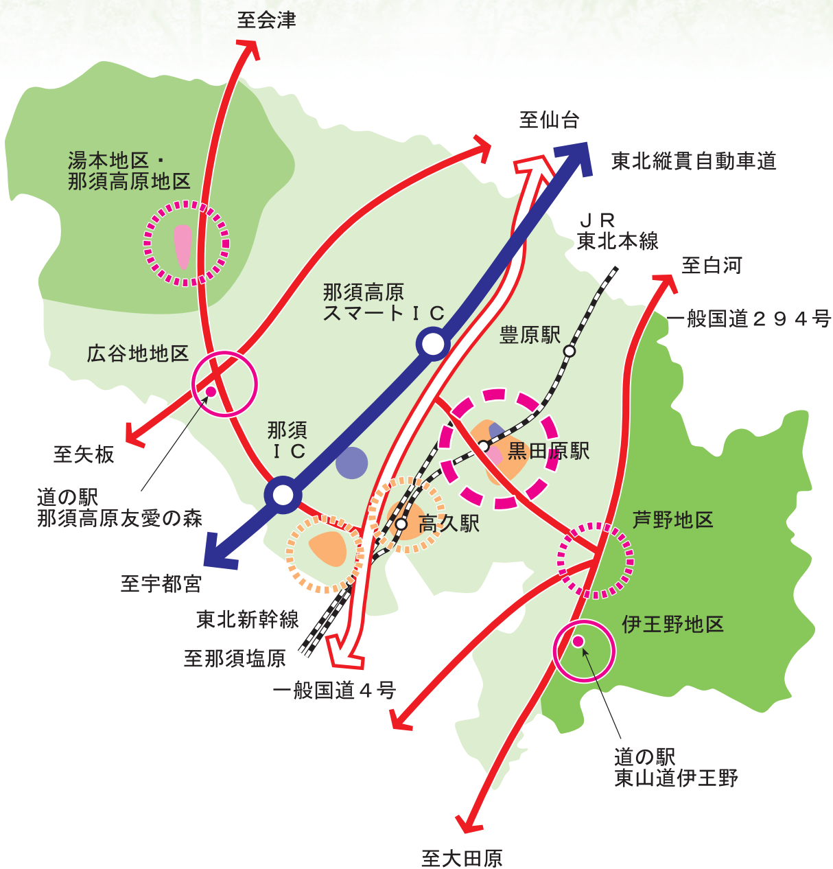
一図：まちの空間構造