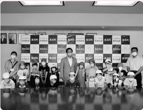
平山町長にたくさん質問しました（高久小）