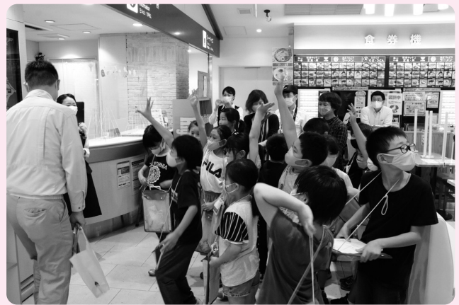
クイズに挑戦！積極的に考え、答えることができました