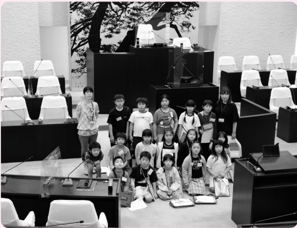
初めて入った議場。とてもわくわくしました（那須高原小）

那須高原小3年生（7月9日）と高久小学校3年生（7月14日）が役場本庁舎を訪れ、仕事の様子を見学しました。町職員から各課の仕事の説明を受けながら、議場など普段なかなか入ることのない場所をまわり、興味津々でメモを取りながら見学しました。