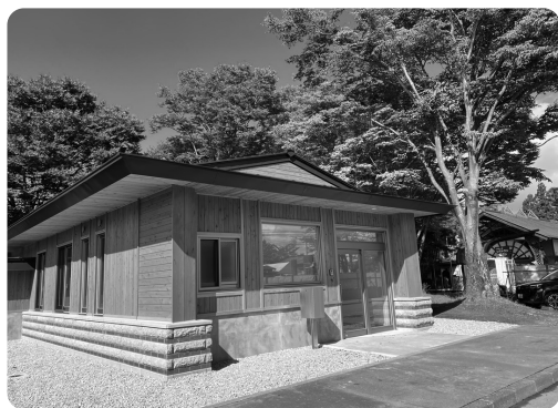
道の駅の管理事務所を増築