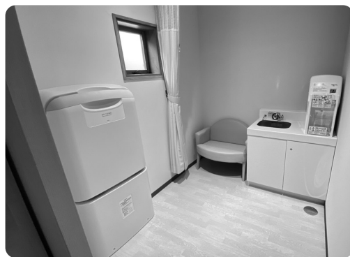
バス待合所に授乳室を新設

令和3年3月から実施している「道の駅那須高原友愛の森」の観光交流センター・アグリ情報館の増改築工事が完了しました。 観光案内所やバス待合所の拡充、授乳室の新設、管理事務所の増築