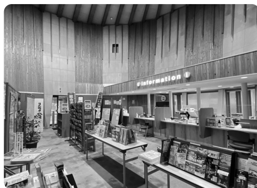
新たに整備した観光案内所