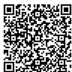
(株)東陽宅建 ホームページ