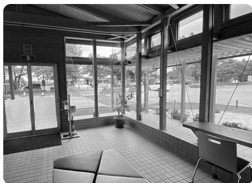
拡充したバス待合所