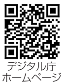
デジタル庁 ホームページ