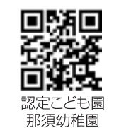
認定こども園那須幼稚園