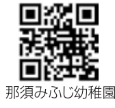
那須みふじ幼稚園