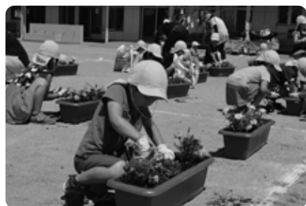
お手伝いで花植えをしたことがある園児も多く、手際よく植えることができました

7月7日、黒田原第1保育園で、年長組26人がプランターにマリィゴールドを植えました。園長先生から「全国から那須町に来る方々をきれいなお花を飾ってお迎えしましょう」と話を聞いた園児たちは、オレンジや黄色のマリィゴールドを丁寧に植えていきました。また、プランターの側面には、園児一人一人が選手への応援メッセージを書いたシールを貼りました。子どもたちが心を込めて作った花プランターは、大会当日、会場に飾り、選手たちの熱い戦いに花を添えます。