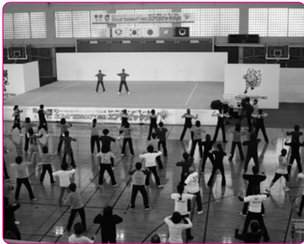
全国スポーツ・レクリエーション祭の様子