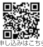
申し込みはこちら