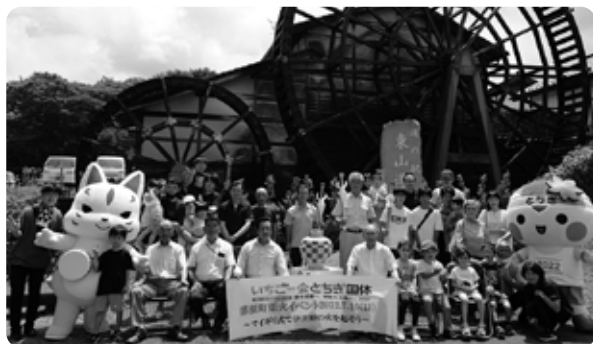
(7/10 道の駅東山道伊王野)

国体の開催機運の醸成と地域の連帯感や郷土意識を高めることを目的に、町内各所において町民参加のもと炬火イベントを実施しています。 那須町版放課後子ども教室（アナザースクール）では、町内すべての小学校でマイギリ式火起こし器による採火（火起こし）に成功し、延べ83人の小学生が参加しました。 また、7月10日には、道の駅東山道伊王野で、伊王野地区の皆さんが大粒の汗をかきながら採火しました。親子が協力し合ってマイギリに挑戦し、やっと着いた火に歓声が上がりました。