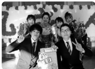
令和4年那須町成人式実行委員の皆さん