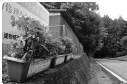
自転車ロードレースコース沿いに飾られたプランターで大会を盛り上げます

町民総ぐるみで町を花いっぱいにし、全国から訪れる方々を真心のこもったおもてなしで歓迎するため、花いっぱい運動を実施しています。現在、町内の事業所や団体の方々に協力をいただき、花とともに応援プレートや選手へのメッセージ入りのシールを貼ったプランターを設置しています。近くを通りかかった際は、ぜひご覧ください。