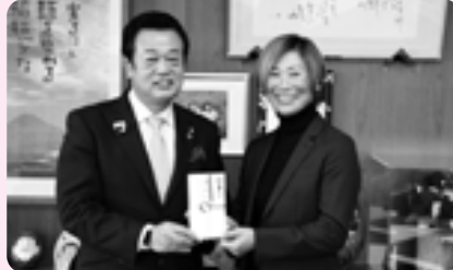
株式会社Spe s様から寄付金をいただきました (12/22 町長室)