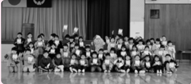
黒田原小学校の子どもたちは本物のサンタクロースに目を輝かせながら、「良い子の証明書」を手渡してもらいました