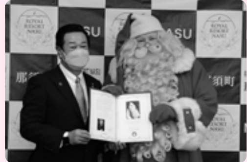
町役場を訪れたサンタクロース。親書や大きなクリスマスリースなどをいただきました(特別会議室)