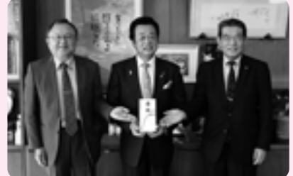
余笹川流域連携ネットワーク様から寄付金をいただきました (12/8 町長室)

5月に開催した那須町高久乙の洋画家(故)田原輝夫氏の遺作展においてご来場いただきました皆様から頂戴したお気持ちを妻のふさ子様から那須高原小学校に寄付していただきました。