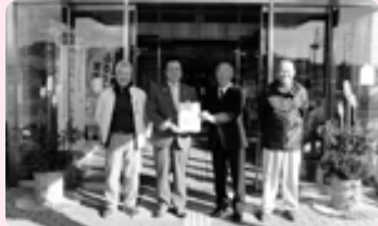
那須町シルバー人材センター様から門松1対を寄贈いただきました (12/23 役場正面入口)