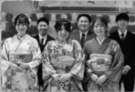
令和5年二十歳のつどい実行委員 (後列左から)