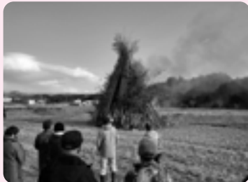
「第25回伊王野下町どんど焼き火入れ式」が行われ、正月のしめ飾りなどを燃やし、五穀豊穡や無病息災などを願いました。 (1/8 道の駅東山道伊王野付近)