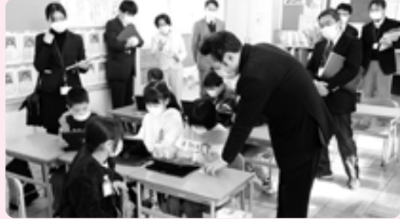
部首を組み合わせて漢字を作り、ゲーム感覚で漢字を学びました（3年1組 国語）

その後、GIGAスクール構想の現状や課題などについて、町長や教育長、町教育委員等の関係者と意見交換が行われました。