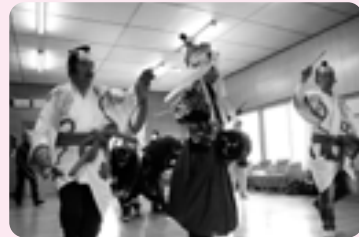
新型コロナウイルス感染症の影響で3年ぶりとなる県指定無形民俗文化財「半俵の寒念仏」が行われ、悪疫防除や五穀豊穡などの願いを込めて、半俵寒念仏保存会の6人が舞を奉納しました。(1/6 半俵公民館)