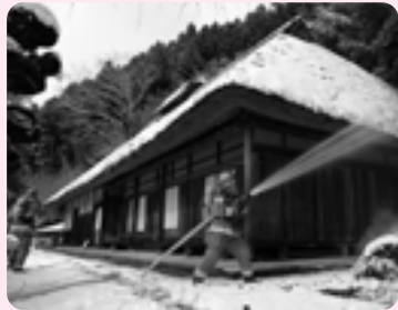
歴史的建造物を火災や震災などの災害から守るため、那須消防署が消防訓練を行いました。 (1/28 国指定重要文化財三森家住宅)