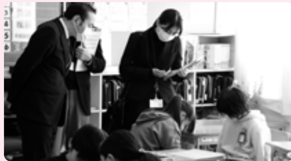
英語の学習とプログラミングを組み合わせた授業が行われました（4年2組 外国語活動）