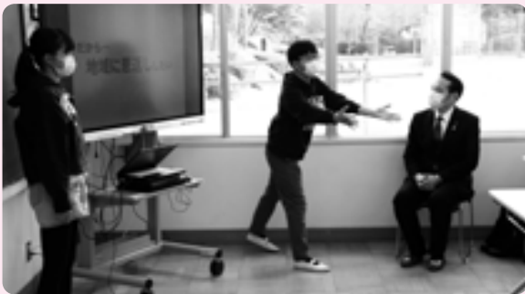
6年生代表の6人が、地域の方々と交流し感じたことを動画にして発表しました