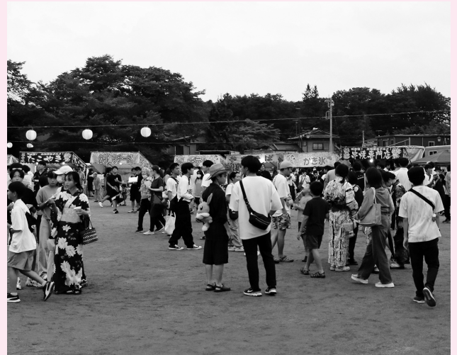
多くの人が、屋台や盆踊り、花火などの夏の風物詩を楽しみました

8月15日、黒田原小学校校庭で第43回なすっこ祭りが開催されました。会場中央にはやぐらが組まれ、小学生をはじめ、地域住民らが盆踊りを楽しみました。