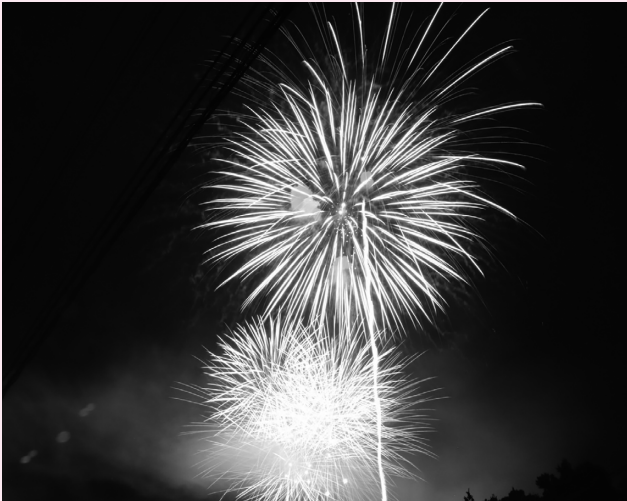
芦野の夜空にきらめく大輪の花火

8月19日、4年ぶりとなる第69回芦野聖天花火大会が開催され、スターメインなど大小さまざまな約3,500発の花火が、芦野の夜空を彩りました。