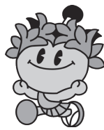
棚倉町シンボルキャラクター「たなちゃん」