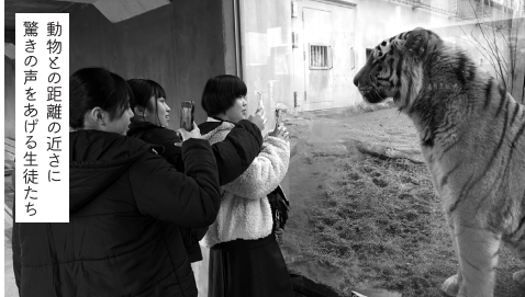
動物との距離の近さ！ 驚きの声をあげる生徒たち