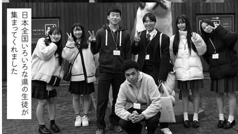
日本全国いろいろな県の生徒が集まってくれました