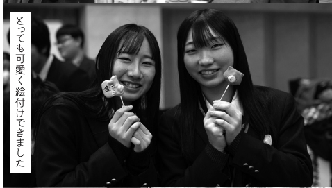
とっても可愛く絵付けできました