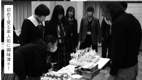
初めて見る串人形に興味津々！