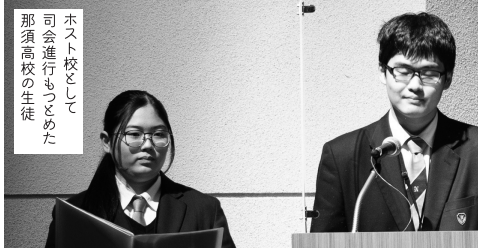
ホスト校として 司会進行もつとめた 那須高校の生徒