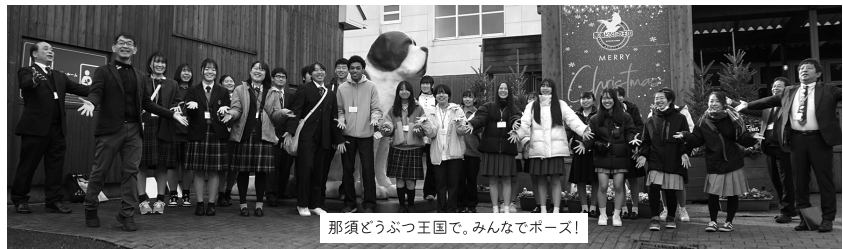
那須どうぶつ王国で。みんなポーズ！