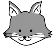
不動産登記推進イメージキャラクター「トウキツネ」