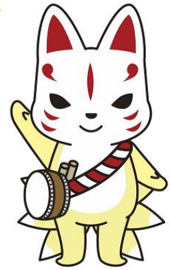
那須町観光大使 「きゅーびー」

今後も那須町を応援していただけるよう、魅力あるお礼品の発掘、リピーター確保に向けた取組みを行ってまいります。