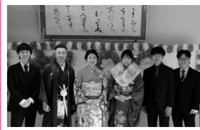
令和6年那須町二十歳のつどい 実行委員のみなさん

令和7年1月12日(日)に開催を予定している二十歳のつどい(旧成人式)の実行委員を募集します。一生心に残る二十歳のつどいを一緒に作りませんか。 ▼ 対象 平成16年4月2日〜平成17年4月1日生まれの方 ▼ 締め切り 5月31日(金) ▼ 申込み・問合せ 生涯学習課生涯学習係 ☎72・6923