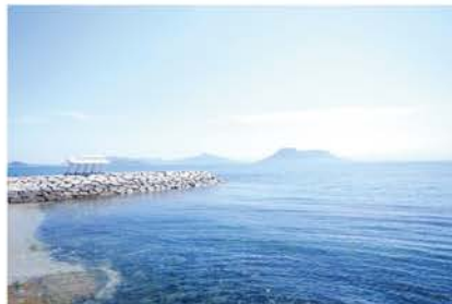
瀬戸内海に浮かぶ小さな島、男木島からこんにちは。