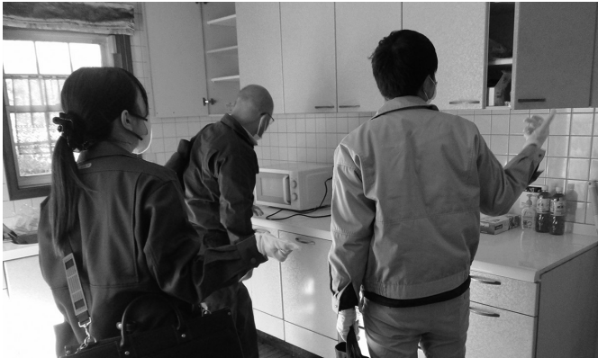
▶ 捜索の様子。滞納者に事前に通知することなく実施します。