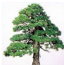
◇町の木 ゴヨウマツ